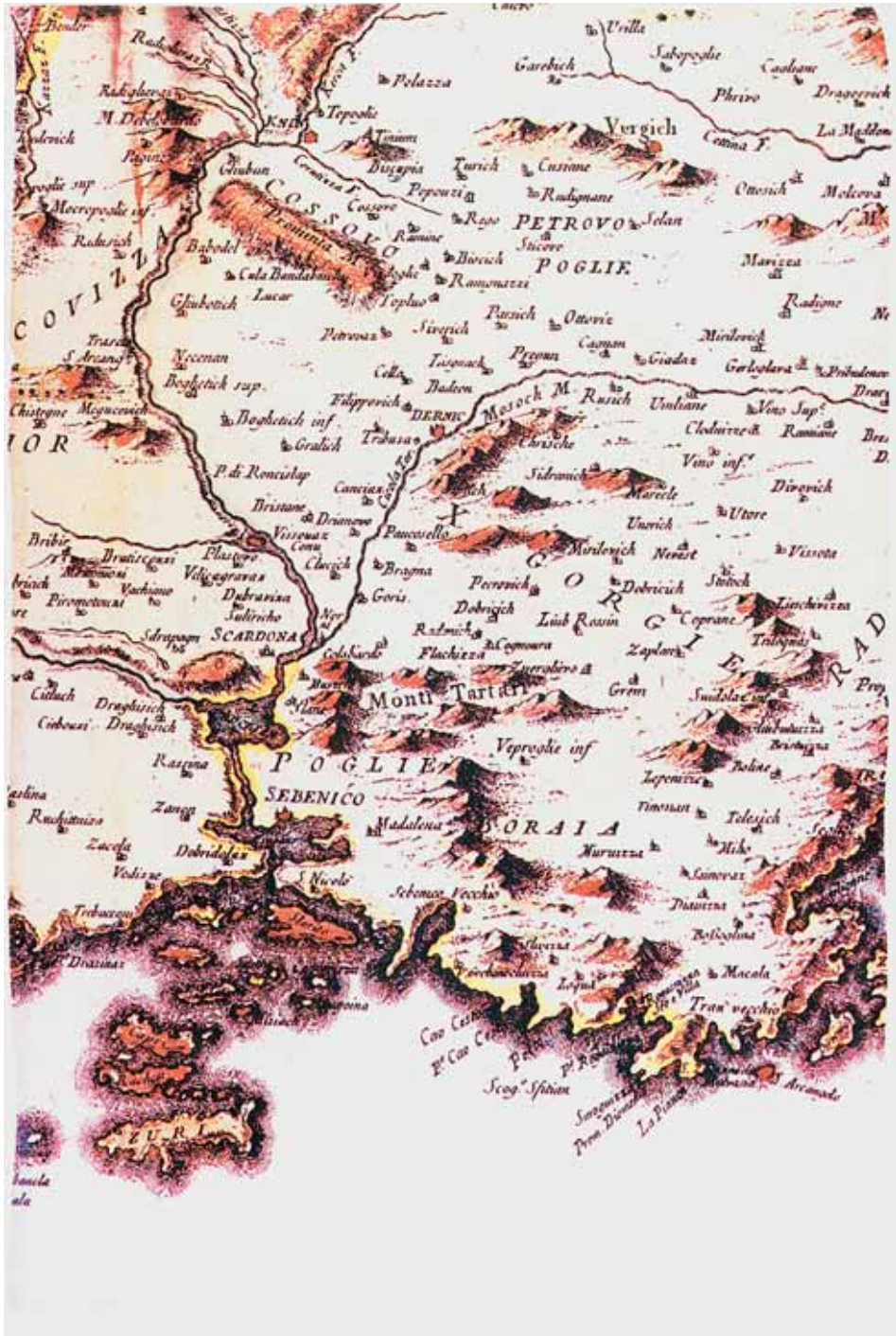
Pietro Santini: ZEMLJOVID SREDNJE DALMACIJE, detalj, Venecija 1780. godine (Povijesni arhiv Zadar)