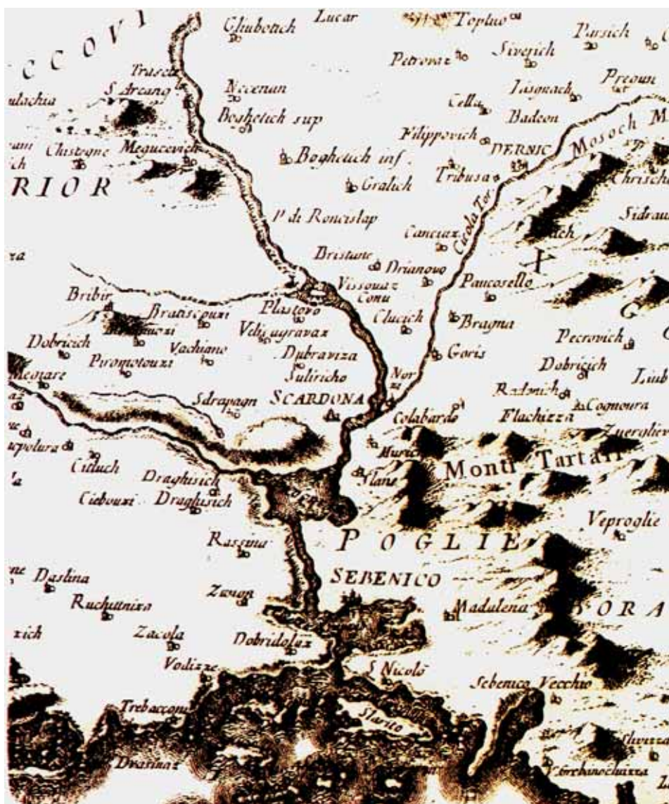
Pietro Santini: ZEMLJOVID SREDNJE DALMACIJE, Venecija 1780. godine, detalj

(kojim se krčilo novo obradivo zemljište) motika, malj, poluga, čekić i kosir , za košenje trave služila je kosa . 8